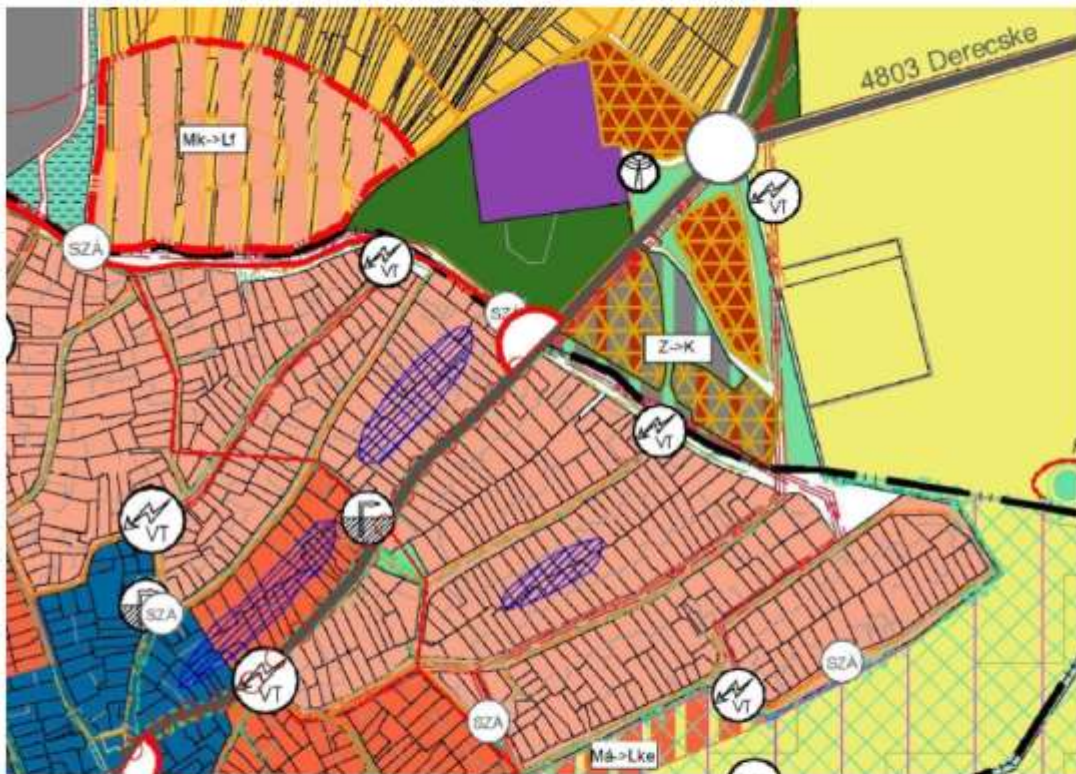
Hatályos településszerkezeti terv részlete