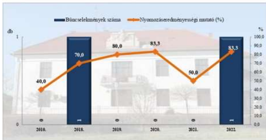
Rendőri eljárásban regisztrált jármű önkényes elvétele bűncselekmények 2010. és 2018-2022. évi ENYÚBS adatok alapján Földes