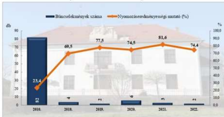
Rendőri eljárásban regisztrált garázdaság bűncselekmények 2010. és 2018-2022. évi ENYÚBS adatok alapján Földes

* a lopások száma tartalmazza a betöréses lopások számát is