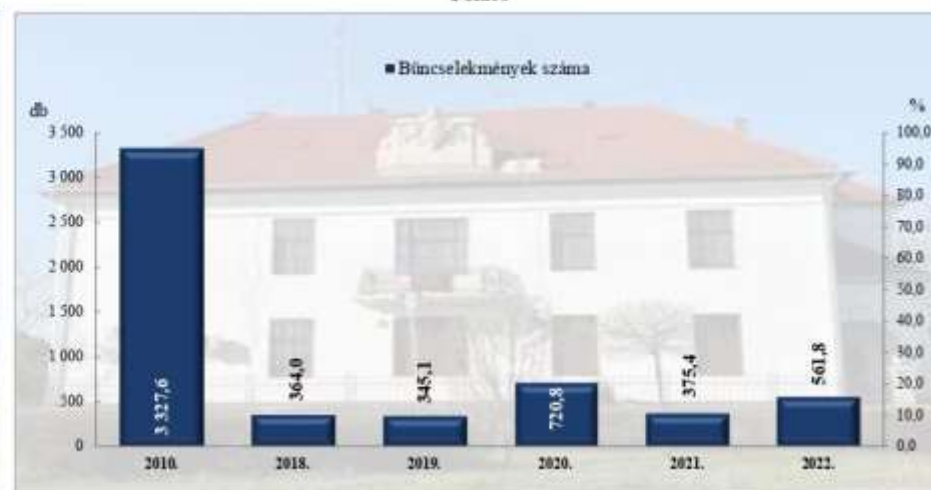
Rendőri eljárásban regisztrált közterületen elkövetett bűncselekmények 2010. és 2018-2022. évi ENYÜBS adatok alapján Földes