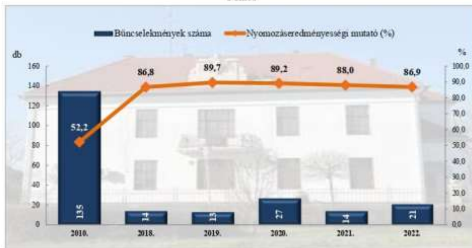
Regisztrált bűncselekmények 100 000 lakosra vetített aránya 2010. és 2018-2022. évi ENYÜBS adatok alapján Földes