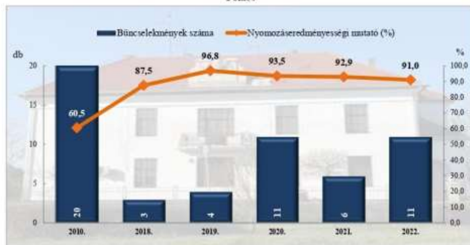
Rendőri eljárásban regisztrált 14 kiemelten kezelt bűncselekmények 2010. és 2018-2022. évi ENYÜBS adatok alapján Földes