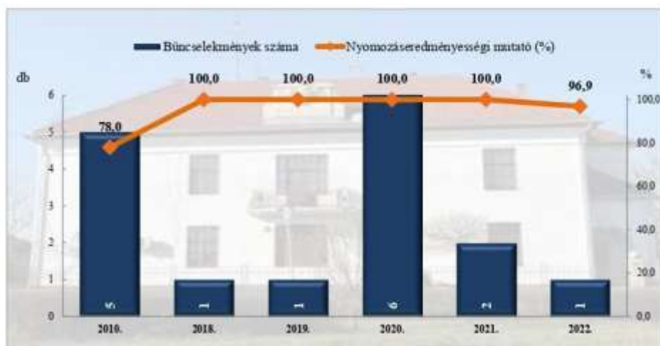
Rendőri eljárásban regisztrált lopás* bűncselekmények 2010. és 2018-2022. évi ENYÚBS adatok alapján Földes

* a lopások száma tartalmazza a betöréses lopások számát is